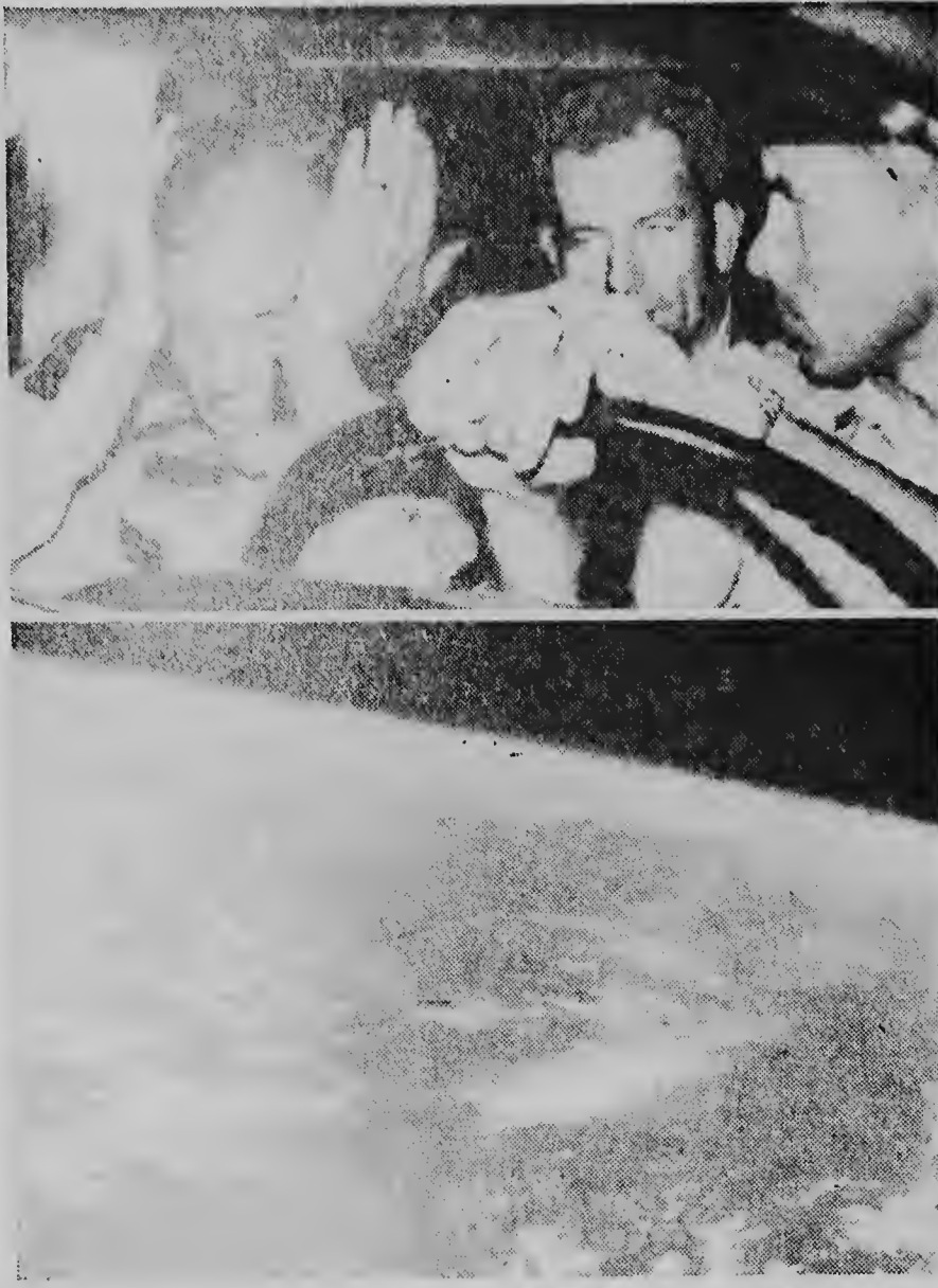
Portrait arriba: Durante un careda di auto na hospital na isla Grand Turk e astronauta a tene su cabez den su mananan. Abajo e portrait mas abaxo: E portrait di mundo aki a ser saca door di camera abordo dje capsula „Friend-1“ cu e astronauta John Glenn a circula rond.